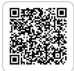
ดาวน์โหลด PDF